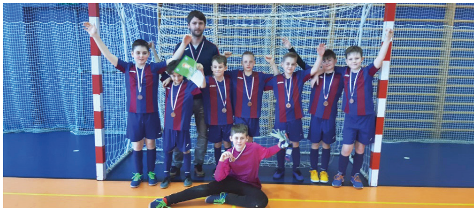
Foto ze závěrečného finálového turnaje halové soutěže Krajské zimní ligy dne 11. 3. 2023 v Brušperku

Starší přípravek (ročníky 2012 – 2013) získala dne 11. 3. 2023 v Brušperku při konání závěrečného finálového turnaje nejlepších šesti týmů KZL bronzové medaile za 3. místo. Po výhrách nad Polankou 2:0 a Frenštátem p. R. 1:0, remizovala s Porubou 1:1 a Krnovem 0:0. Jediná prohra 0:1 toho dne s pozdějším vítězem domácím Brušperkem znamenala obrovský úspěch našeho klubu z celkového počtu 42 zúčastněných družstev dlouhodobé halové soutěže Krajské zimní ligy.